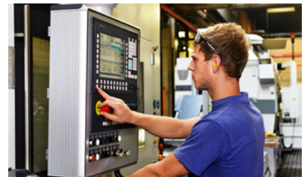
Maschinen- und Anlagenführer